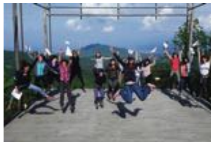
Categoria “Associazioni private” WECHO - L'eco delle donne di montagna Fondazione Nuto Revelli, Cuneo