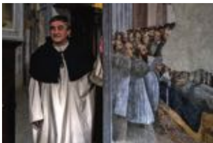
Categoria “Enti Pubblici” Tour di Lallio - Un Paese in scena Comune di Lallio (BG)

per la Valorizzazione del Patrimonio Culturale materiale e immateriale, edizione 2023